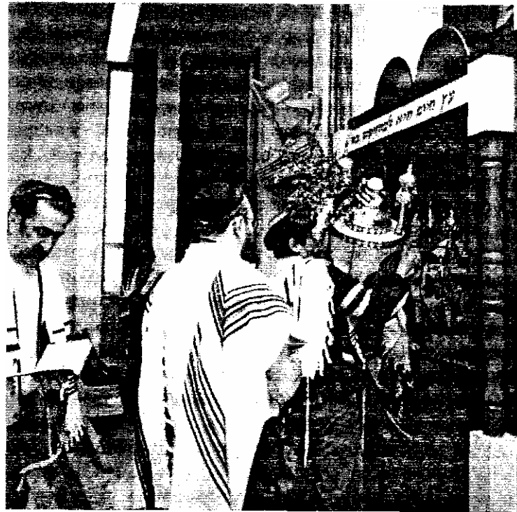
С древнейших времен до наших дней со свитками Закона обращаются с величайшим почтением

Свиток Торы — это пергаментный свиток, на котором написаны первые пять книг Библии. Он тщательно скопирован от руки особыми чернилами профессиональным сойфером (писцом). Алфавит еврейского языка состоит только из согласных букв. Здесь нет гласных — диакритических значков печатного варианта, нет знаков пунктуации, отсутствуют музыкальные обозначения над буквами, которые направляли бы читающего во время пения. Все это делает чтение свитков Торы нелегкой задачей, и многим, кто, возможно, хотел бы быть удостоенным чести читать Тору, недостает навыков в иврите. В реформистских общинах свиток Торы укреплен на двух роликах внутри тяжелого деревянного или металлического ящика с резьбой или гравировкой