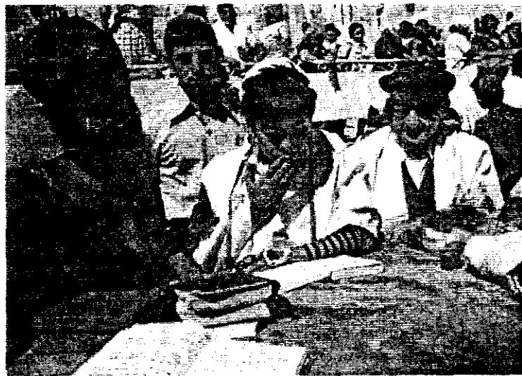
Бар Мицва — праздник совершеннолетия

Многие евреи считают, что «арба миним» придается определенный символический смысл, но, как часто бывает в таких случаях, они не могут договориться, какой именно. В соответствии с одним из мидрашей, под четырьмя растениями подразумеваются четыре части тела: этрог — это сердце, лулав — позвоночник, мирт — глаза и верба — рот. В другом толковании четыре растения интерпретируются как указание на разные типы людей, где вкус означает разум, а аромат — добрые дела. В соответствии с этим толкованием, этрог имеет одновременно вкус и аромат и представляет тип человека, который одновременно знает Тору и действует в соответствии с ее предписаниями; плоды лулав (финики), имея вкус, не имеют аромата и представляют тип человека, который изучал Тору, но не делает добрых дел; мирт имеет аромат, но у него нет вкуса, и он представляет, таким образом, тип человека, который делает добрые дела, но не изучает Торы; и наконец, под вербой, которая не имеет ни аромата, ни вкуса, понимается человек одновременно невежественный и обаяливый. Это наиболее популярное толкова-