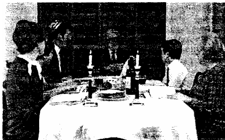
Пэсах — праздник семейный