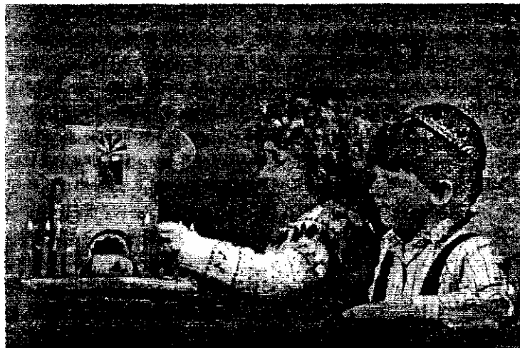
Ханука — праздник Огней

Прятать и затем искать кусочки хамца — широко распространенный ритуал. 14-го числа месяца Нисана устраивают церемонию их поиска, часто всей се-